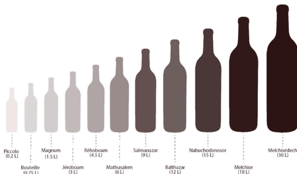
Les noms et tailles des différentes bouteilles de vin